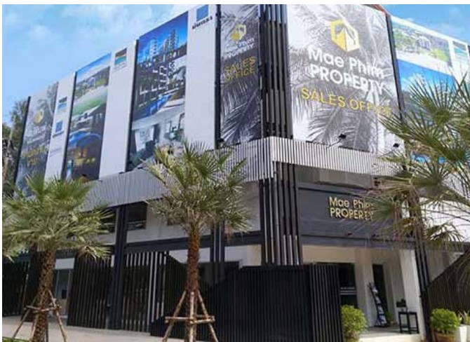
สำนักงานขายโครงการ อยู่ติดถนนเลียบริมหาดแม่พิมพ์ ถัดจากโรงแรมแกรนด์บลู รีสอร์ท