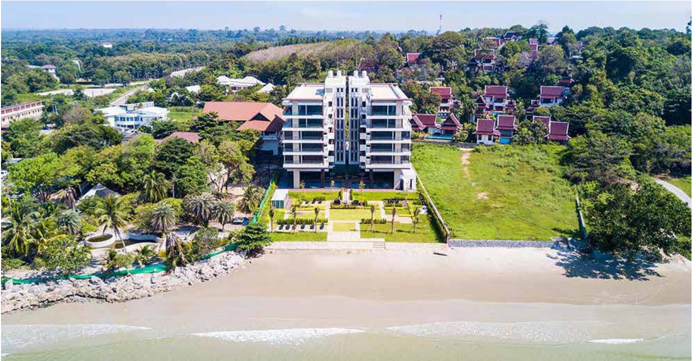
Escape Condominium, หาดแม่พิมพ์, โดย Mae Phim Property/SilverseaHouse Co. Ltd.