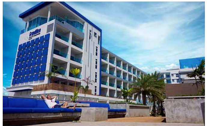
SilverseaHouse Co. Ltd. / Mae Phim Property, ผู้เป็นเจ้าของ GrandBlue Resort