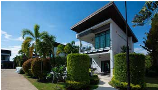
ภาพถ่ายในพื้นที่ที่อยู่อาศัยสถานที่จริง