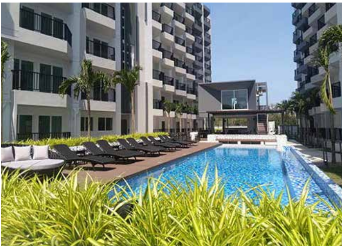
มันตรา คอนโดมิเนียม แม่พิมพ์

สำนักงานขายของเราเปิดให้บริการ ข้อมูลข่าวสาร เกี่ยวกับโครงการ และ ท่านสามารถเข้าเยี่ยมชมโครงการต่าง ของเรา ณ หาดแม่พิมพ์ ได้ทุกวัน